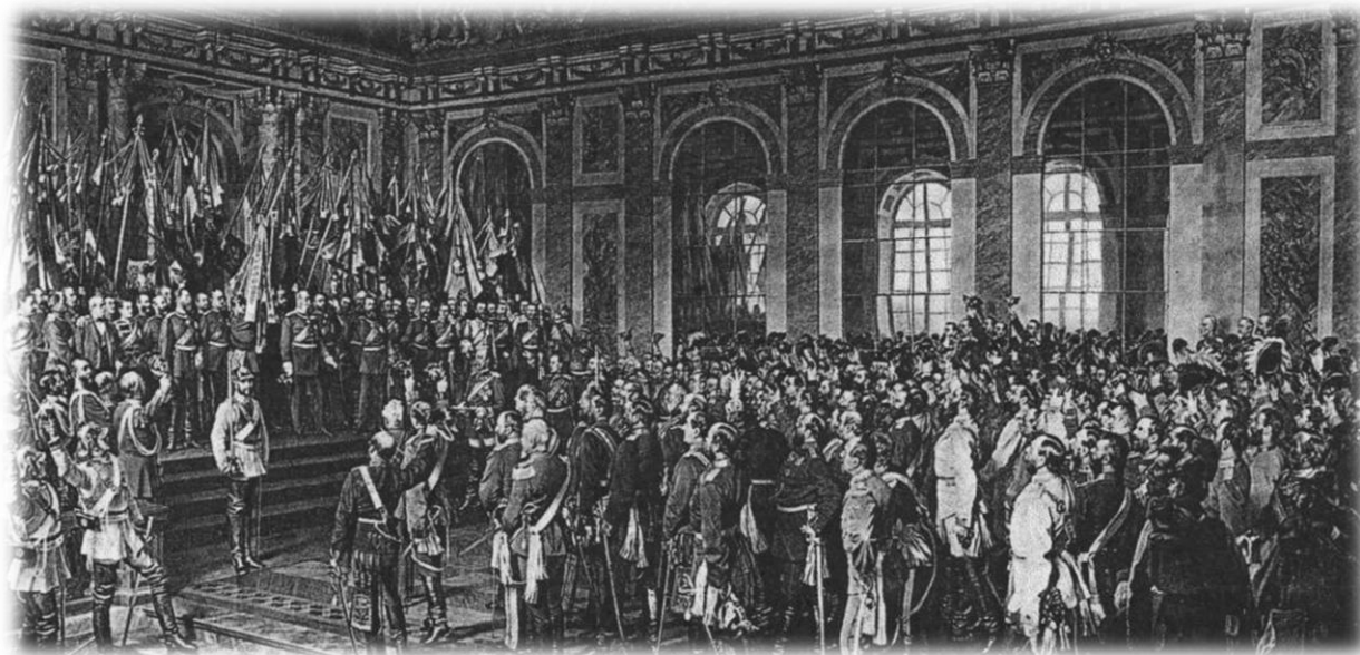
تاجگذاری امپراتور ویلهلم اول در کاخ ورسای

عاقبت در ۱۰ مه ۱۸۷۱ دولت جمهوری فرانسه باب مذاکرات با امپراتوری آلمان را در شهر فرانکفورت گشود. آلمانی‌ها کلیه ایالت آلتزاس و شهر متز را به همراه نیمی از لورن تصرف کردند. همچنین فرانسه مجبور شد غرامت سنگینی در حدود ۵ میلیون فرانک به دولت آلمان پرداخت کند؛ البته آلمانی‌ها مطابق این قرارداد اجازه داشتند تا زمانی که فرانسه این مبلغ سنگین را پرداخت نماید، نیروهای نظامی خود را در ایالات شمالی فرانسه نگه دارند.