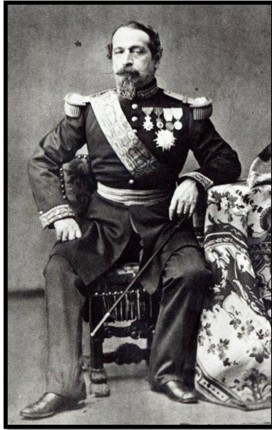
امپراتور ناپلئون سوم

جنگ پروس و فرانسه آخرین مرحله از این برنامه‌ی سازمان‌یافته بود. فرانسه در آن ایام به رهبری ناپلئون سوم - برادرزاده‌ی ناپلئون کبیر - بر دیپلماسی اروپا مسلط شده و به هیچ وجه ظهور رقیبی تازه را بر نمی‌تابید.