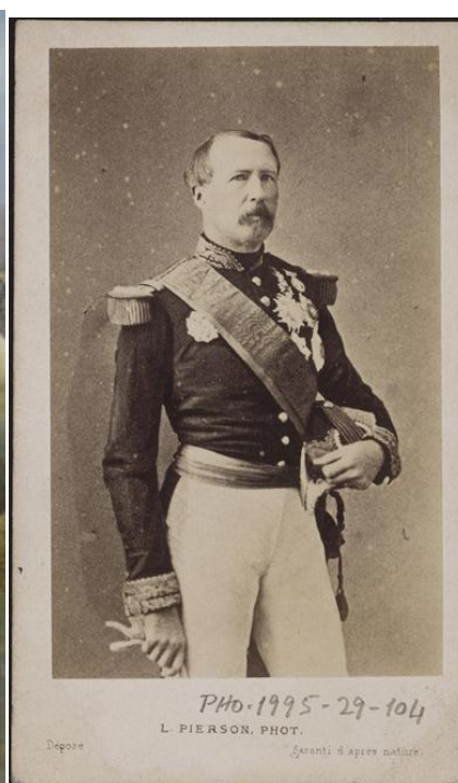
ژنرال مک ماهون

امپراتور ناپلئون سوم برای رسیدگی به اوضاع جنگ، شخصاً سرپرستی جناح راست فرانسه را برعهده گرفت. نیروهای تحت فرمان او برای آزادسازی شهر متز از محاصره آلمانی‌ها، به سوی این منطقه به راه افتادند اما خودشان هم به دام ارتش آلمان افتادند. در ۳۱ اوت نیروهای جناح راست فرانسه (شامل ۸۳ هزار سرباز) به همراه امپراتور ناپلئون توسط نیروهای آلمانی محاصره شدند.