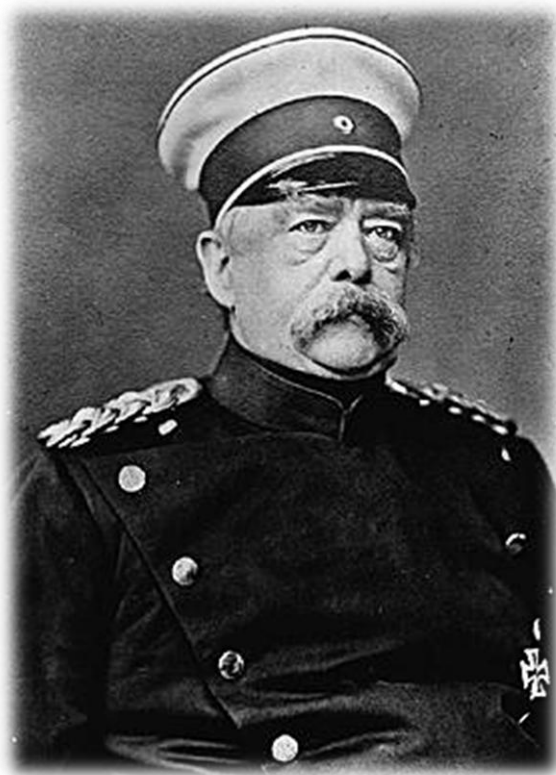
اتو فون بیسمارک

پادشاهی پروس که اتحاد و یکپارچگی آلمان بزرگ را رسالت خود می دانست ، به رهبری اسمی امپراتور ویلهلم اول و در اصل ، راهبری اتو فون بیسمارک در دهه ۱۸۶۰ به این هدف ، جامه‌ی عمل پوشاند.