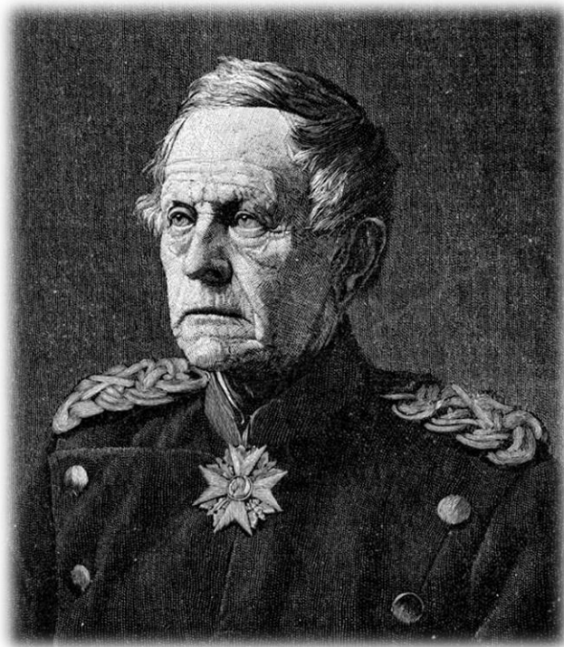
ژنرال هلموت فون مولتکه

ایالات جنوبی آلمان دعوت بیسمارک را اجابت کرده و در جنگ میهنی علیه فرانسه به او پیوستند. برتری آلمانی‌ها به لحاظ نفرات بود؛ در حالی که فرانسویان تنها ۴۰۰ هزار سرباز آماده‌ی جنگ داشتند، آلمانی‌ها با احتساب نیروهای ذخیره توانستند بالغ بر یک میلیون سرباز بسیج کنند. از طرفی دیگر، فرانسه فاقد فرماندهان نظامی لایق و کاردان بود؛ در مقابل، آلمانی‌ها از وجود فرماندهی بهره مند بودند که شانه به شانه‌ی بیسمارک، طرح‌های نظامی اتحاد آلمان را به پیش برده بود: ژنرال هلموت فون مولتکه. ژنرال مولتکه نقشه دقیقی برای هجوم سریع به داخل خاک فرانسه طراحی کرد.