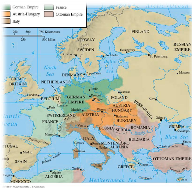
نقشه اروپا در سال ۱۸۷۱

جنگ فرانسه و آلمان (۱۸۷۰-۱۸۷۱ م.) تبعات و نتایج بلندمدتی در پی داشت. این جنگ منجر به پیدایش دو نظام جدید در آلمان و فرانسه شد: ۱- جمهوری سوم فرانسه که از این زمان تا ۱۹۴۰ -- که با حمله نظامی آلمان نازی سرنگون شد - به حیاتش ادامه داد. ۲- امپراتوری آلمان که تا ۱۹۱۸ - یعنی زمانی که پس از شکست در جنگ جهانی اول، سقوط کرد - پابرجا ماند.