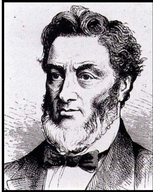
ژول فاور؛ وزیر امور خارجه فرانسه

هنگامی که محاصره پاریس طولانی شد، قحطی جان افراد بسیاری را گرفت. مدافعین پاریس برای مقاومت در برابر آلمانی‌ها، به مردان و زنان نیز اسلحه دادند تا از شهرشان دفاع کنند اما هیچ راهکاری جز تسلیم برای آنها باقی نمانده بود.